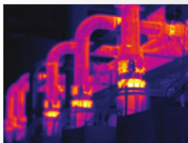
Manual focus 手動對焦

100 % 對焦 – 每個物件。近遠皆宜。MultiSharp™ Focus。多點對焦