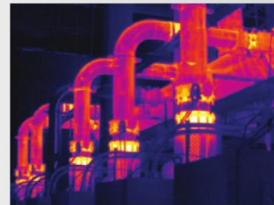
MultiSharp Focus 多點對焦