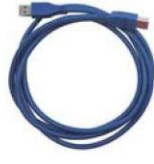
USB 3.0 傳輸線