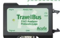
TB1016B / B+