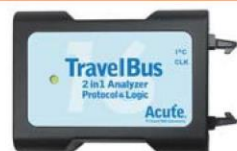
TB1016F / E