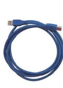
USB 3.0 傳輸線