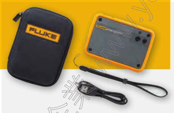
4 Fluke 公司 PTi120 便攜式口袋熱像儀