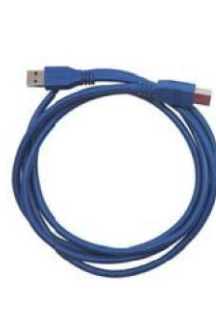
USB 3.0 傳輸線